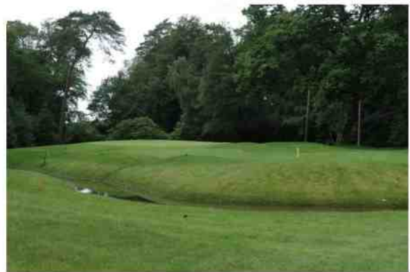
Op NC 17 (Par 5) kreeg de green meer 'humps and bumps' én werd omzoomd met een lange greppel