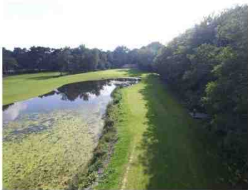
De nieuwe hole NC 12 (Par 3): luchtfoto met zicht op de bosrand en de waterpartij vanaf de Men's Tee box

Het Rinkven Masterplan loopt helemaal volgens plan: het nieuwe caddyhouse is al klaar, een grotere parking werd aangelegd, er zijn uitgebreide practice faciliteiten, bar en restaurant zitten in de pop-up, de nieuwbouw van het clubhouse is gestart en onze golfbanen liggen er weer prima bij! Enkele North Course highlights: