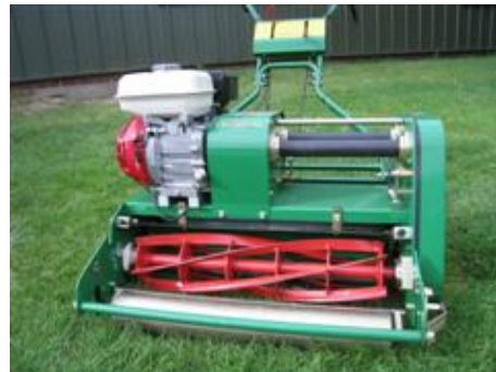
Cilindermaaier “knipt” het gras

De cilindermaaier is intensiever in onderhoud en afstelling. Vóór elke maaibeurt wordt de maaihoogte gecontroleerd en de maaischerpte afgeregeld. Als je bedenkt dat we de greens op 4mm maaien, is dit precisiewerk.