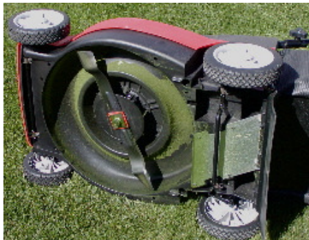
Rotatieve maaier “slaat” het gras af

De rough wordt met een rotatieve maaier gemaaid. Het grote verschil is dat een cilindermaaier het gras “knipt” omdat de cilinder tegen een ondermes draait en een rotatieve maaier het gras “afslaat”. De meeste grasmaaiers, voor particulier gebruik, zijn rotatieve maaiers.