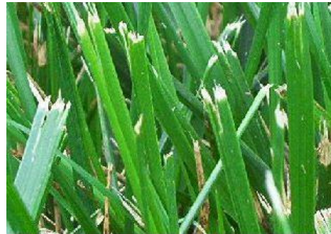
Tips of grass blades ripped from dull mower blade.

Als je net je gras gemaaid hebt weet je nu dus waar je op moet letten. Veel succes ermee!