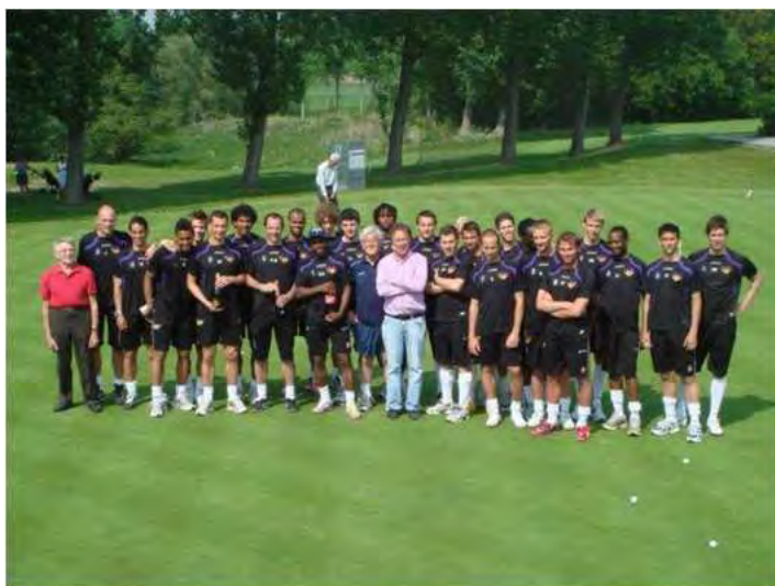
Een trotse voorzitter