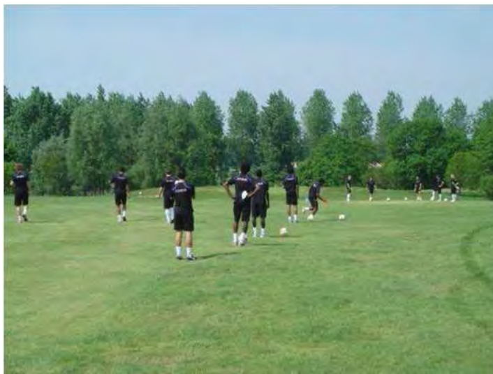
Slow play !!