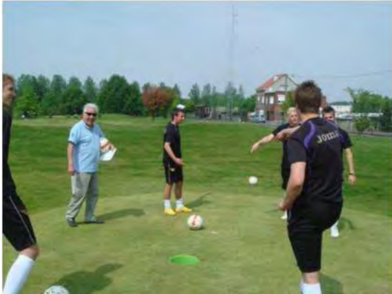
Discussie over het aantal "trappen"