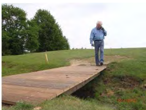
Bij het einde van de werken werd onmiddellijk het hoofdkantoor gebeld om de goede uitvoering te bevestigen