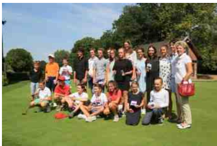
Ternesse Junior OPEN U12 2de plaats