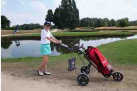
Millenium Junior OPEN U12 3de plaats