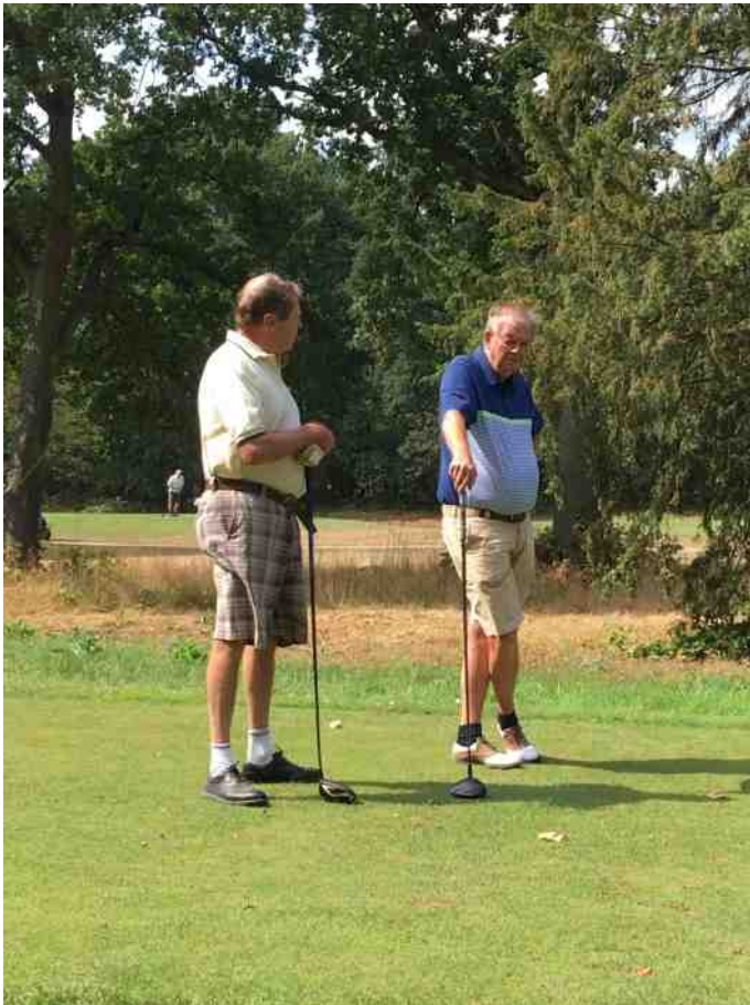
Cleydael: Doen we het of doen we het niet?