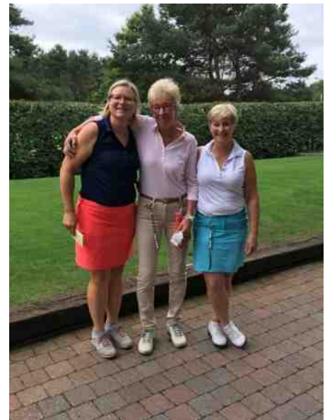
Keerbergen: wij hebben er zin in!