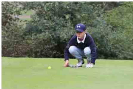
Royal Latem Golf Club SCAPA Kids: 4de plaats