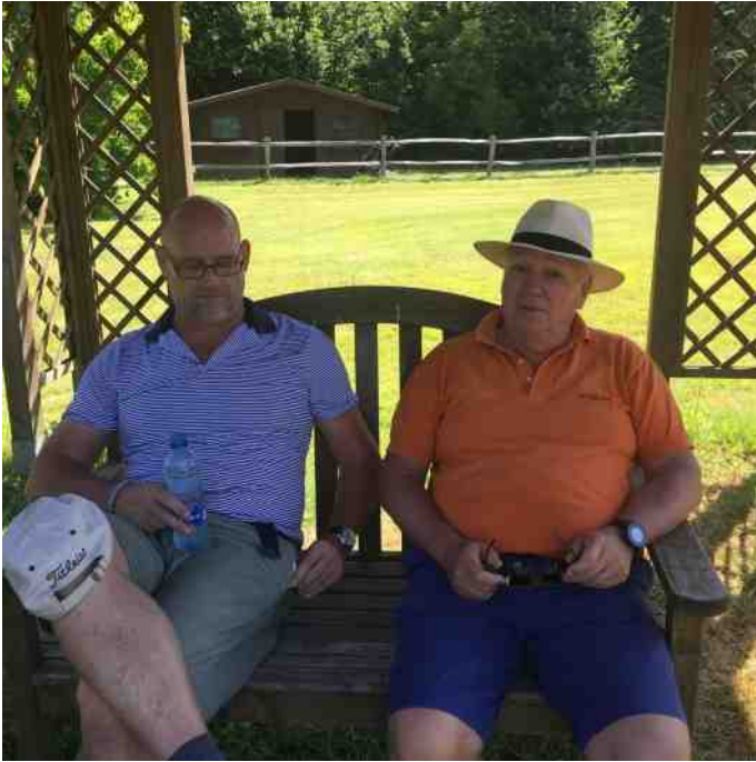
En of het warm was in Kampenhout!