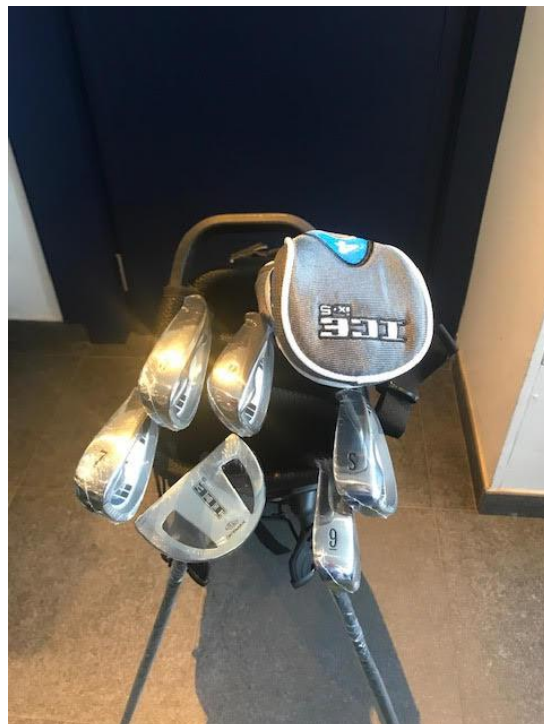
VOLLEDIGE SET MET GROTE DRAAGTAS (7 vakken) 370 €