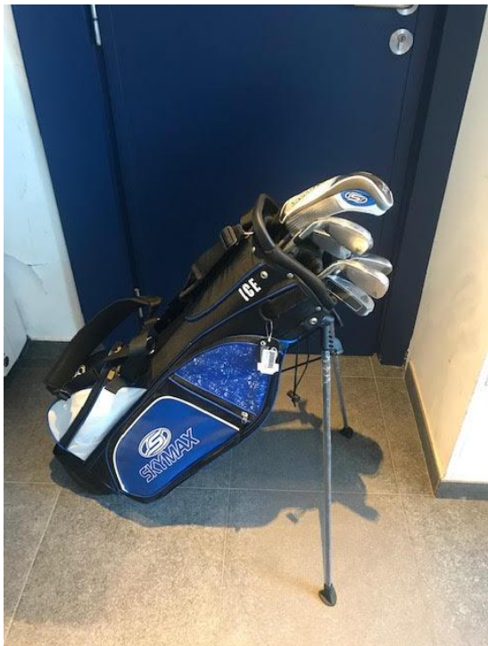
HALVE SET MET KLEINE DRAAGTAS 200 €